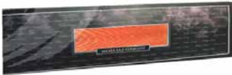
Saumon fumé tranché main