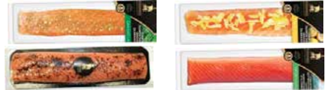
Cœurs de filet de saumon : nature, aneth, truffes, citron