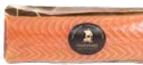
Cœur de Filet de saumon