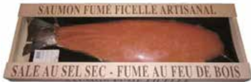
Saumon fumé ficelle