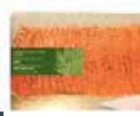
Aiguillettes de saumon